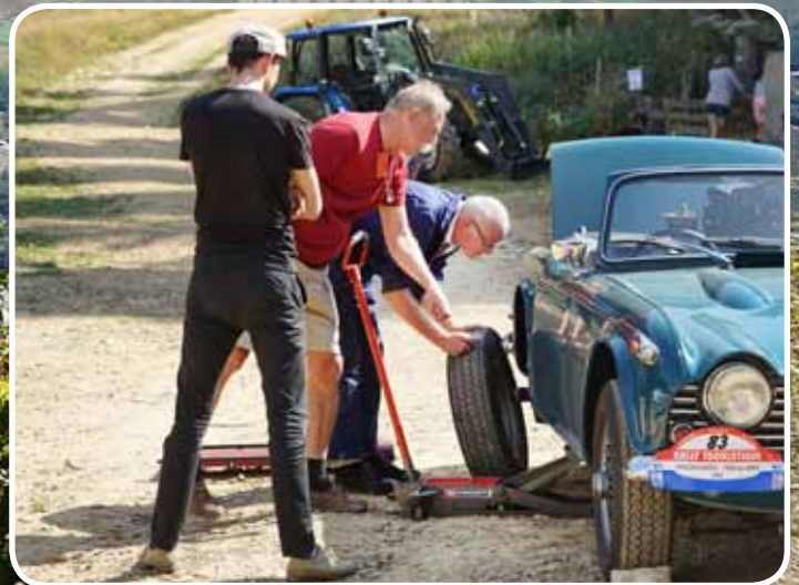
Service team(s) & Trailer/Leenauto

Met het bezoeken van een aantal extra toeristische bezienswaardigheden en het rijden van bepaalde meer sportieve trajecten kunnen de Toerklassers extra bonuspunten verdienen, waarmee Gouden, Zilveren en Bronzen medailles te verdienen zijn. Tijdens de dagelijkse gezellige Bonusborrel worden de behaalde bonuspunten door de officials op uw Bonuskaart bijgeschreven.